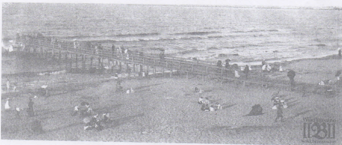
Koniec XIX wieku.