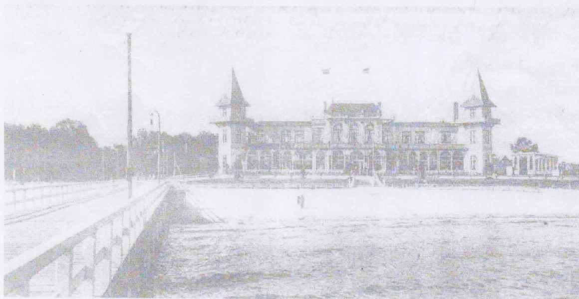
Widok z moła w kierunku hali plażowej ok 1905 rok.